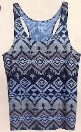
TOP MONKI ca. 15 Euro