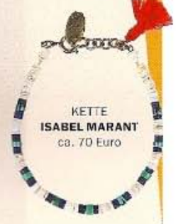
KETTE ISABEL MARANT ca. 70 Euro