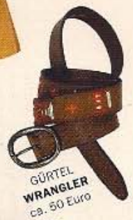
GÜRTEL WRANGLER ca. 50 Euro