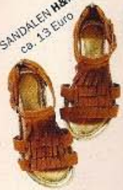
SANDALEN H&M ca. 13 Euro