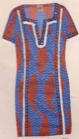
HELD TORY BURCH ca. 370 Euro