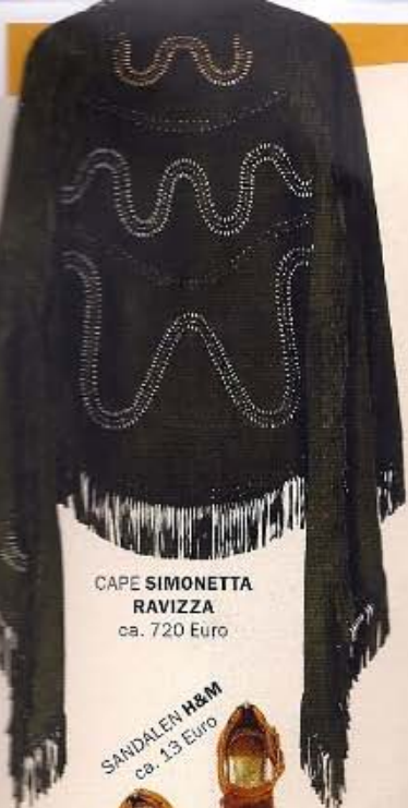
CAPE SIMONETTA RAVIZZA ca. 720 Euro