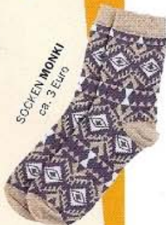
SOCKEN MONKI ca. 3 Euro