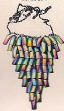
KETTE CHEAP MONDAY ca. 35 Euro