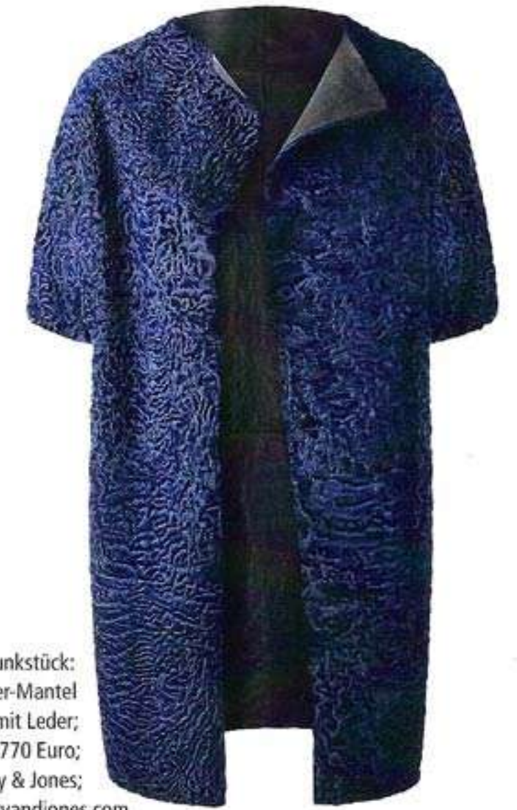
Blaues Prunkstück: Persianer-Mantel mit Leder; 4770 Euro; Schacky & Jones; www.schackyandjones.com