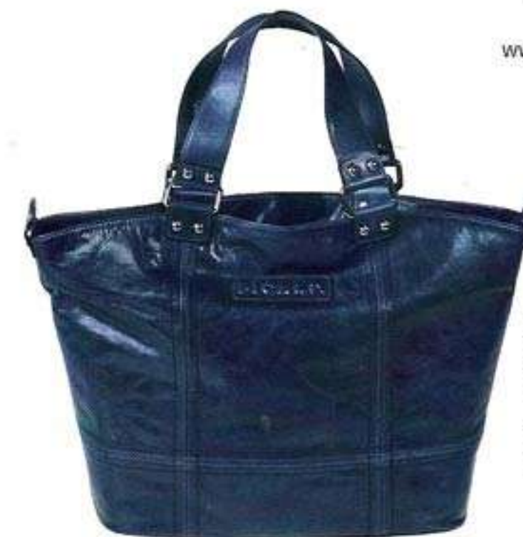
Stauraum in Blau: Tasche von Picard; 199 Euro www.picard- lederwaren.de