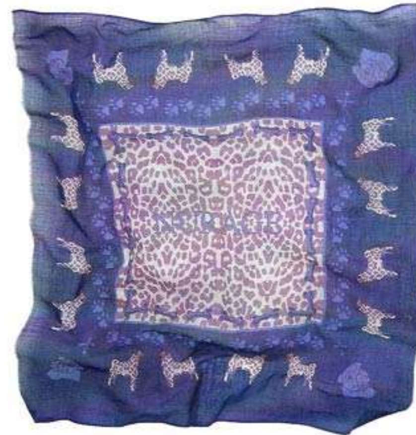
Tuch mit Mops-Motiven aus Wolle und Seide; zirka 99 Euro; www.nurage.de