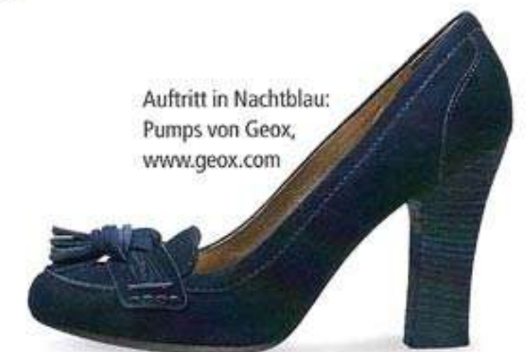
Auftritt in Nachtblau: Pumps von Geox, www.geox.com