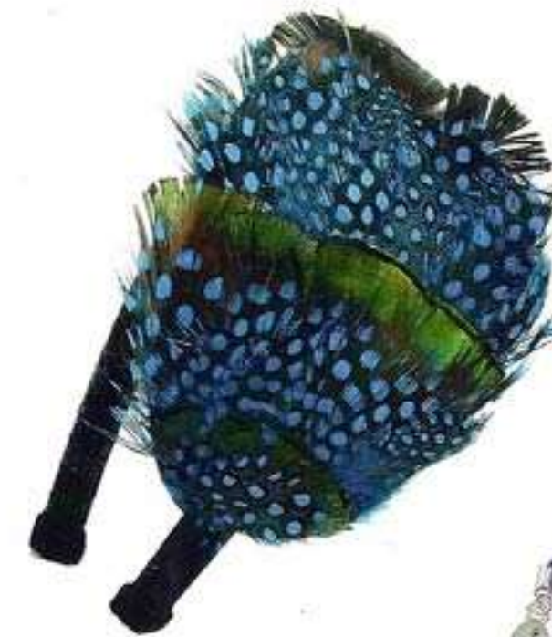
Federhaarreif „Osiris“ von Verlocke! Zirka 14,95 Euro; www.verlockeshop.de