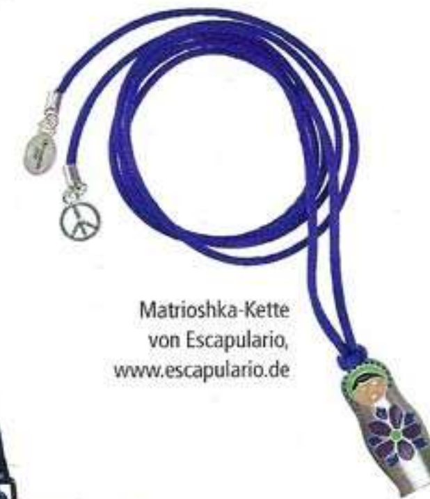
Matrioshka-Kette von Escapulario, www.escapulario.de